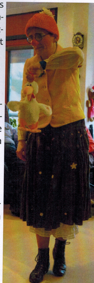
Lilly in Aktion